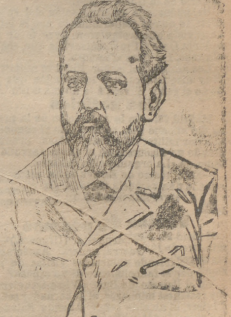
Don Rafael Gasset y Chinquilla