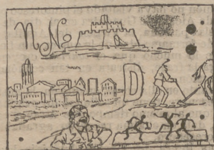
Solución al jeroglífico anterior: Canudo Castillo Flores.