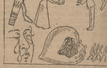
Solución a la charada anterior: Doble m ente. Idem al jeroglífico: San José era carpintero.

Jeroglífico Solución a la charada anterior: Doble m ente. Idem al jeroglífico: San José era carpintero.