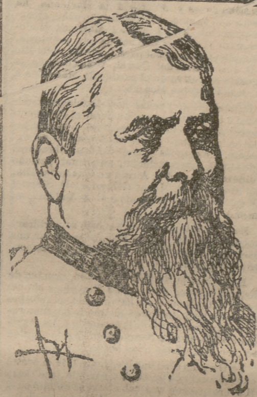
El Sr. Fitzhugh Lee

Lindante con el Prado de San Sebastian se halla un oasis llamado el parque de María Luisa, porque la augusta hermanita de Isabel II, segregándolo de sus suntuosos jardines, lo ha cedido a la ciudad para su embellecimiento y recreo de los sevillanos. El presente ha sido verdaderamente regio: bosques de tilos y acacias, paseos de álamos y cipreses, calles de rosales y naranjos, susurros de fuentes bulldoras, trinos de pájaros que anidan en las copas de espléndida verdura, brisas del vecino Guadalquivir, impregnadas de los azahares que bordan sus riberas, forman el encanto de este antiguo vergel de los castellanos de San Telmo, cuyo palacio, medio oculto por la espesura, se destaca al frente con su dorada verja y su gran portada de piedra, que remata la estatua del santo religioso, llevando en sus brazos el simbólico navio.