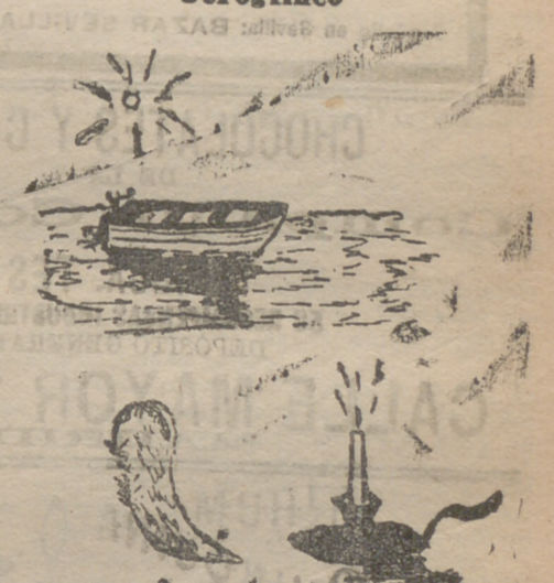
Solución al jeroglífico anterior: Tortas y pan pintado.

podido sorprenderos hace tiempo. ¡Qué hubierais corrido entonces! Ya agotada su energía, ahogada su voz por los sollozos y llenos sus ojos de lágrimas, Valentina se dejó caer en un sillón, exclamando: —Partid, os lo suplico, partid. ¡Ah, debéis complaceros en esto! ¡Qué os he hecho para que me perjudicéis de tal modo en lo que más amo en el mundo? Profundamente emocionado en presencia de tan extrema desesperación, anestado al ver la exaltación que se notaba en la vizcondesa y que podía conducir á adoptar horribles resoluciones, y comprendiendo, en fin, á pensar del apasionamiento que le dominaba, todo lo censurable que era su conducta, sintió despertarse en su alma los puros mandatos del honor, y arrojándose á los pies de la mujer del ciego como ante una santa, le dijo respetuosamente: —Si, he cometido una mala acción; sí, soy doblemente culpable, pero quiero purgar mi falta; partid. —¡De veras! ¡De veras! ¡Esta misma tarde! —¡No más pronto posible; acaso mañana. —¿Y no os veréis con nadie? —Os lo prometo. —¿No escribiréis nada? —¡Oh! No me podréis escribir. —¡Puedo separarme de ese modo de la que amo, de la que adoro en toda mi alma! Deseo que sepa que es precisamente por amor por lo que me marcho con el corazón destrozado y dispuesto á morir,