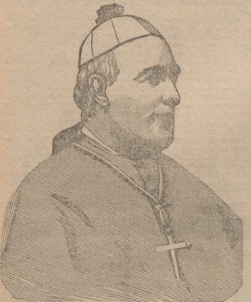
EL OBISPO DE BARCELONA