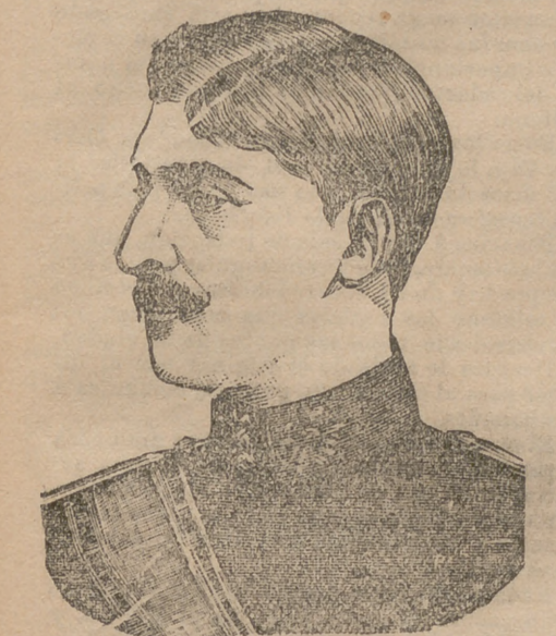
El príncipe Víctor Alberto

En números anteriores hemos dado á conocer el retrato y algunos pormenores biográficos de los individuos de la familia real de Rumania.