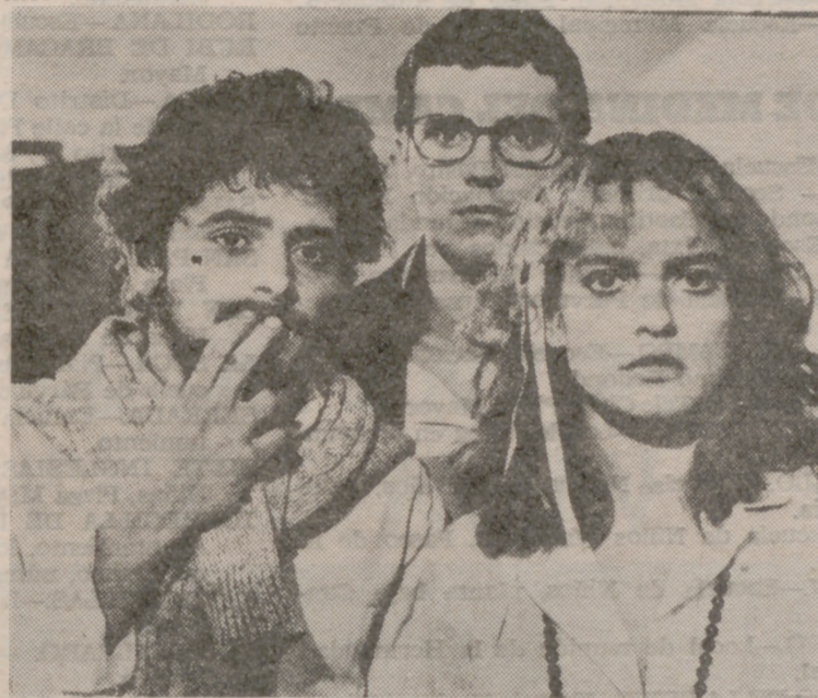
Gustó la película española «Tres en raya», de Francisco Romá.

protagonista de esta «ópera prima» de García Hurtado quien toma a los propios habitantes del lugar como actores de su filme. Tiene el filme cierta fuerza emotiva, presentando con bastantes efectos la situación vivida, pero, poco a poco, la película va cayendo en un auténtico panfleto. Los parlamentos de los líderes campesinos llegan, incluso, a rozar límites insospechados, no en aquella revolución, sino en cualquier otra.