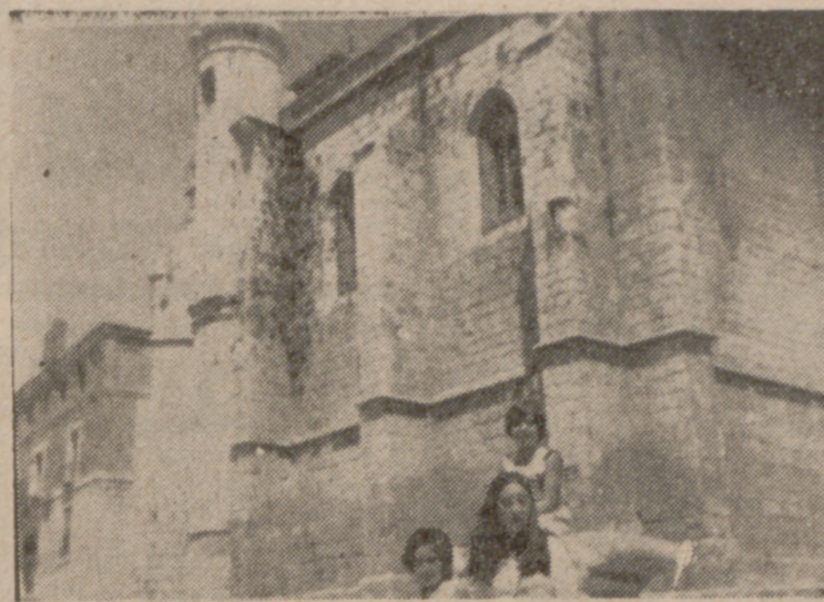
Capilla gótica de los Alderete. A la izquierda de la imagen se advierte el palacio de Rodríguez de las Varillas.