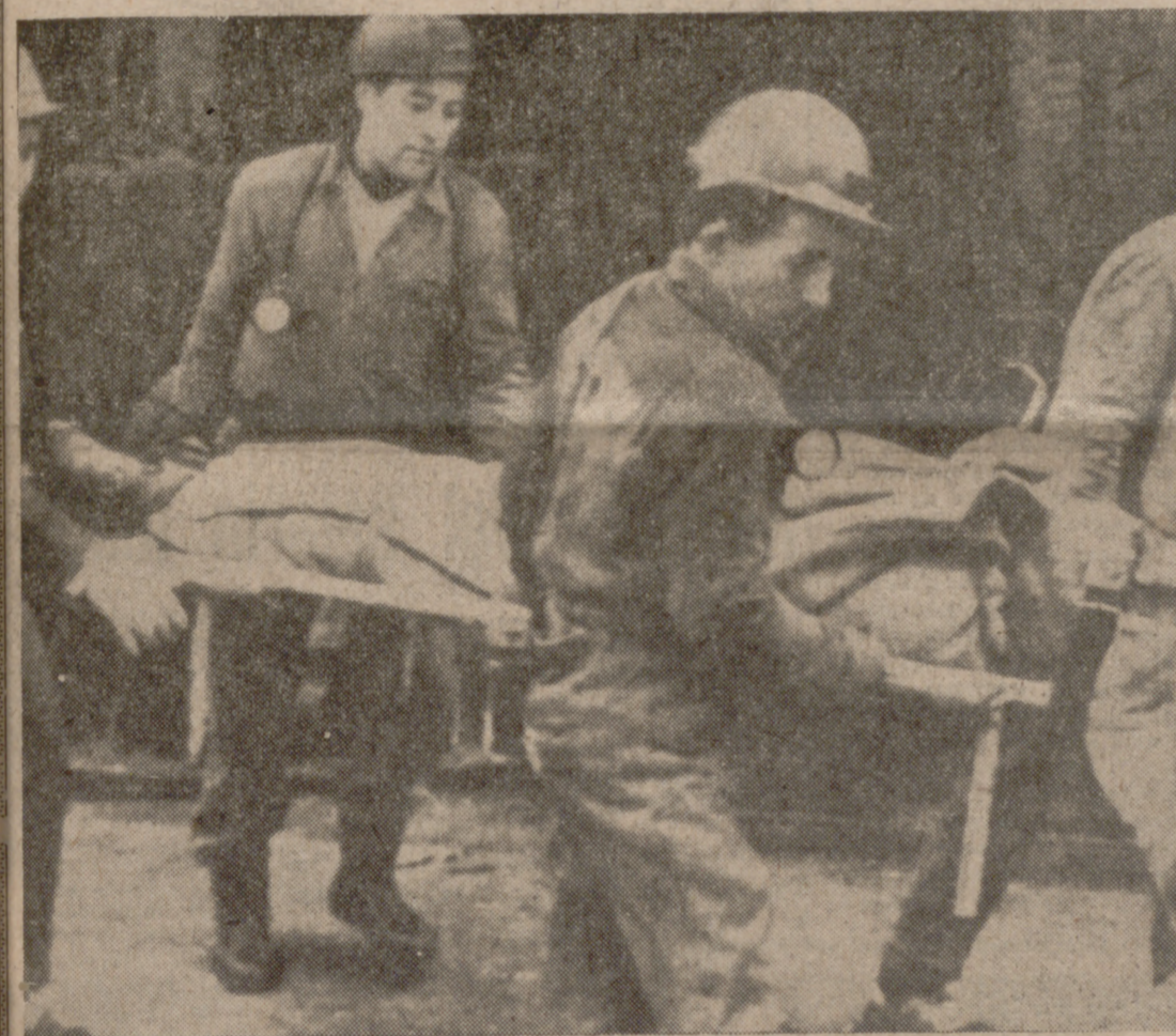
PAMPLONA.—Evacuación de uno de los seis mineros muertos a consecuencia de la explosión registrada ayer en el pozo «Undiano», de «Potasas de Navarra». Al producirse la explosión trabajaban en dicho lugar catorce obreros que quedaron sepultados, aunque posteriormente fueron rescatados ocho, que sufren diversas heridas.