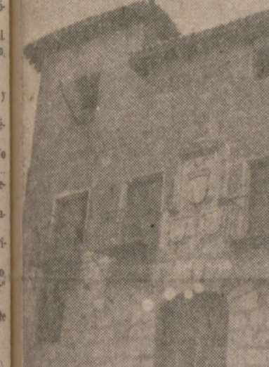
PALACIO DE ARDALES DEL RIO.