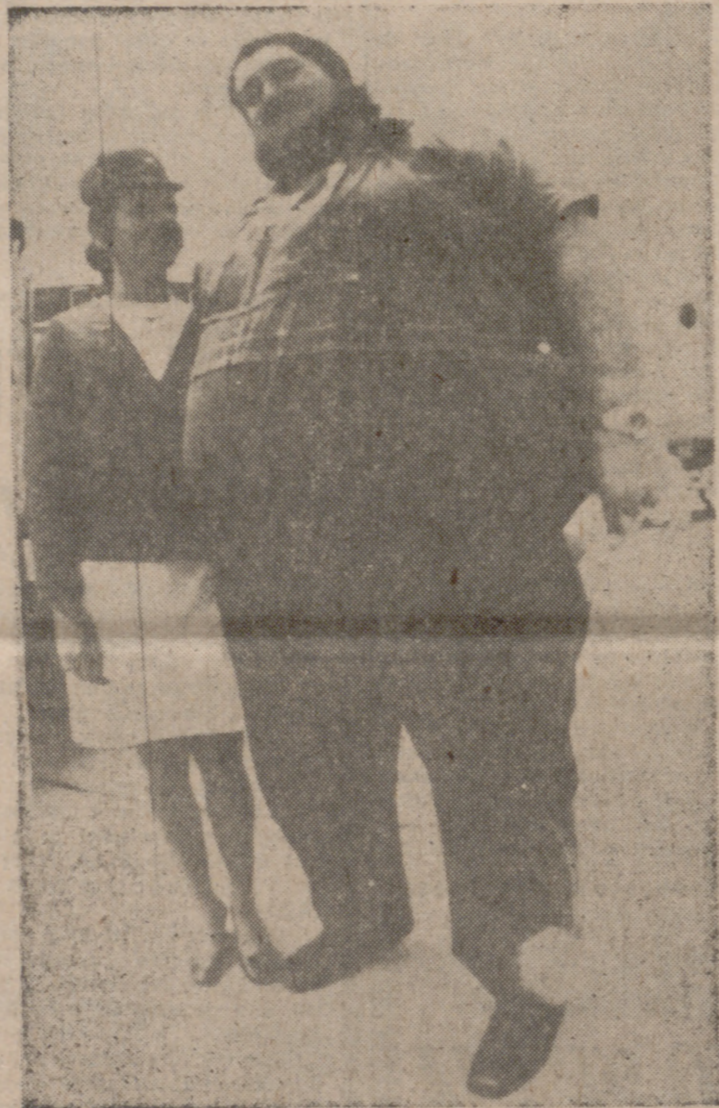
Haystacks Calhoun, obeso él, como salta a la vista, ocupa dos asientos cuando viaja en avión. Una de las servidumbres de la obesidad es que quienes la padecen necesitan demasiado espacio.