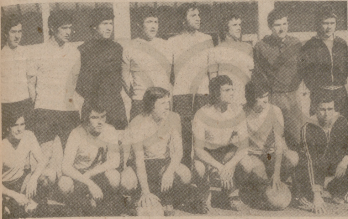
ASKLEPIOS, BRILLANTE CAMPEON JUVENIL

minuto 19, arrojándose a los pies de Arroyo. En el minuto 22 dispara con fuerza Romero y devuelve el larguero de la portería del Asklepios. Un minuto después Bayón tiene una clara ocasión de aumentar el marcador, pero Villagarcía, con cierta fortuna, despeja con el pie. Continúa el juego nivelado y ambos equipos trenzan jugadas de buena factura que el público aplaude. Cuando está a punto de finalizar la primera mitad, un tiro parabólico de Joaquín es desviado por la escuadra, llegando al final de la primera parte con el resultado de uno a cero, siendo los últimos minutos lo mejor y más destacado del encuentro.