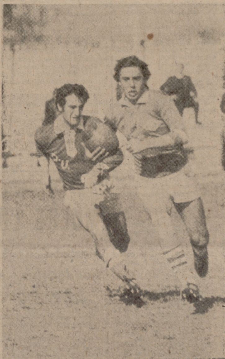
(INFORMACION EN LA PAGINA SIGUIENTE)