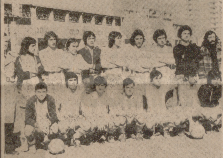
FORMACION DEL REAL VALLADOLID JUVENIL

REAL VALLADOLID: Villagarcía; Maxi, Valdespino, Germán; Carlos, Víctor Manuel; Arroyo, Romero,