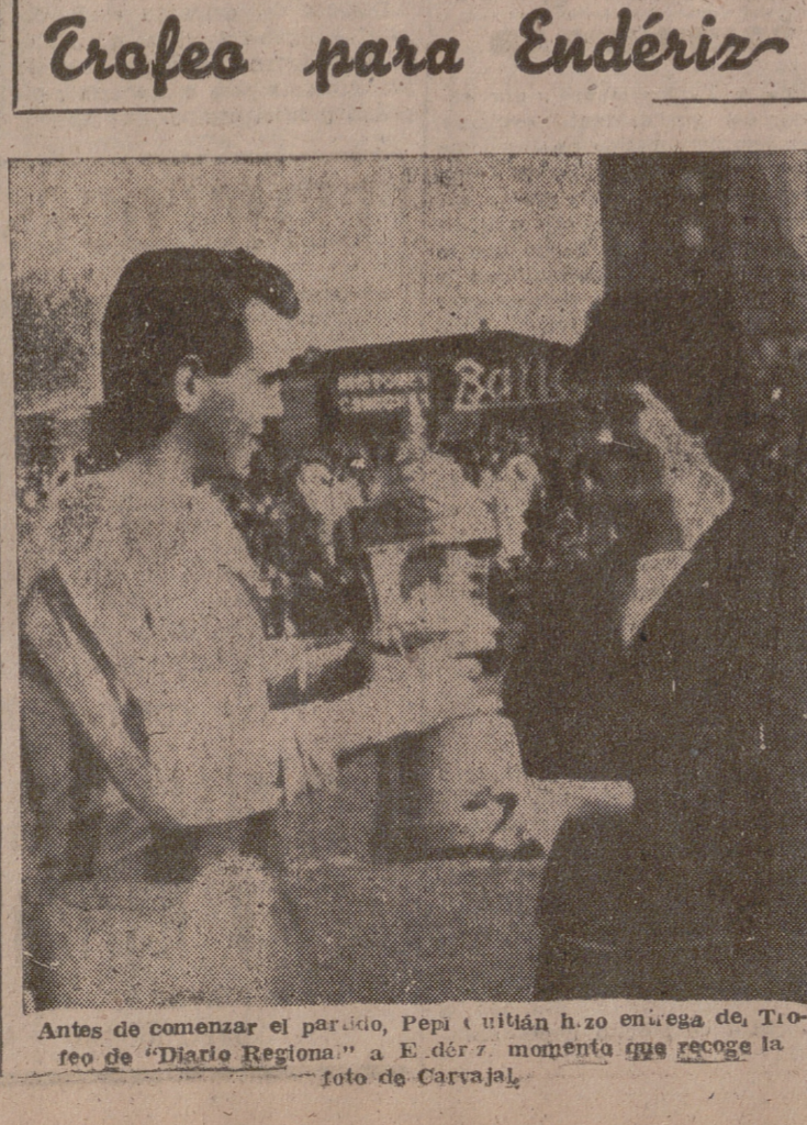
Antes de comenzar el partido, Pepi (titán) hizo entrega de Trofeo de "Diario Regional" a E. del momento que recoge la foto de Carvajal.