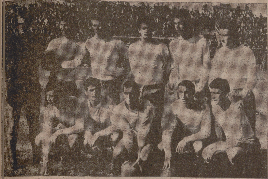
EL CONJUNTO ISLEÑO QUE AYER PERDIO EN ZORRILLA POR 2-0