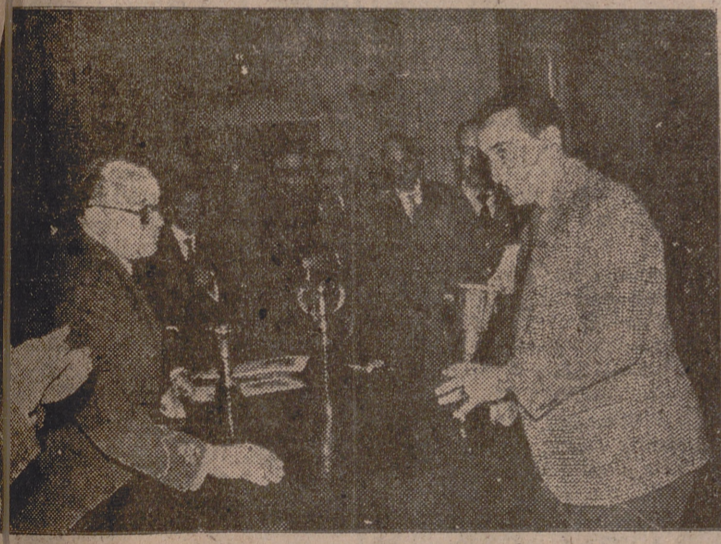
Momento de la entrega de premios.