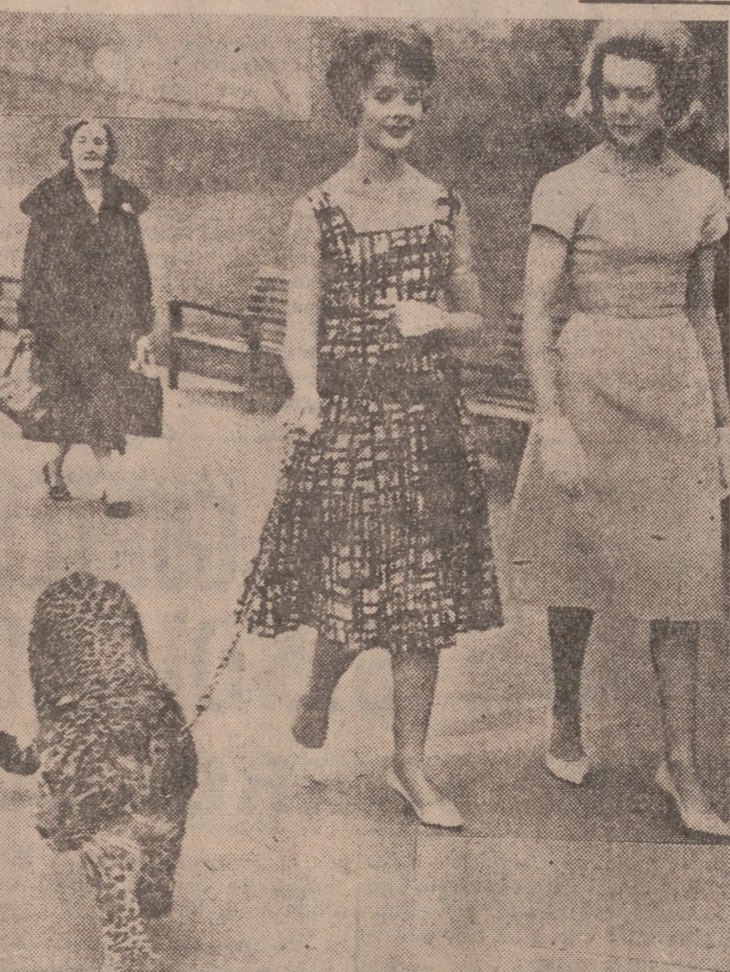
Orgullosa de haber dado su nombre a una loción para el cabello, el leopardo Kit, de vuelta de un cocktail en su honor, se hace acompañar al zoo de Cincinnati por dos maniques.