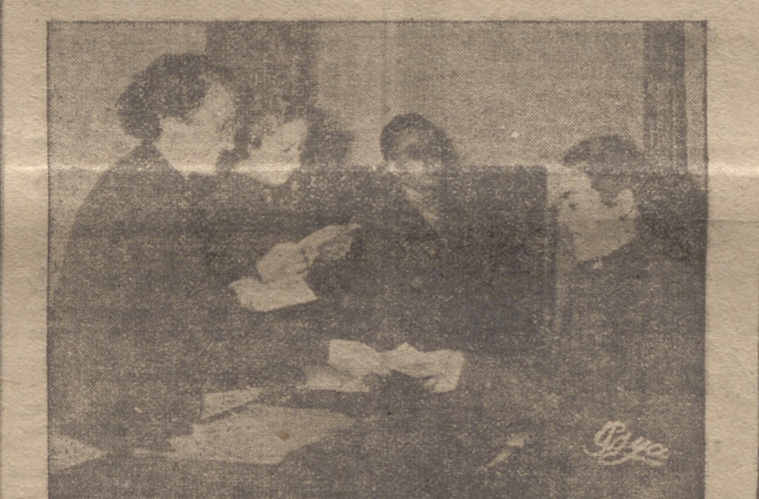
Momento de entrega de los carnet a los enlaces sindicales. La delegada provincial hace entrega de uno de ellos.

El pasado sábado, día 19, en la Escuela Hogar de la Sección Femenina, se clausuró el curso anual de enlaces sindicales. Después de la última clase, dada por el vicesecretario de Ordenación Social, y a la que asistió el delegado provincial de Sindicatos, se celebró el acto de clausura del curso, presidido por la delegada provincial de la Sección Femenina, todo el profesorado de este curso y mandos de la Sección Femenina.