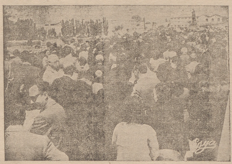
Momento de la bendición de los campos desde el Puente de Hierro, presenciada por un numeroso público.

mejorar el nivel de vida de sus semejantes y elevar el agro español, colocándolo a la altura que por sus propios méritos y por la protección del Estado merece alcanzar para que el honrado cultivador de la tierra tenga siempre un lugar de preferencia en la economía de la nación.