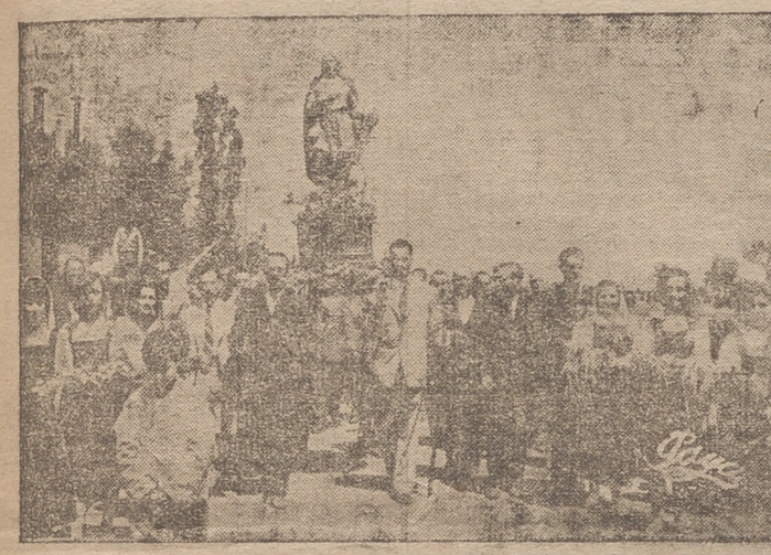
La imagen del Santo, a hombros de los labradores, rodeada por un grupo de señoritas logroñesas portadoras de las ofrendas de flores y frutos. (Información en tercera página)