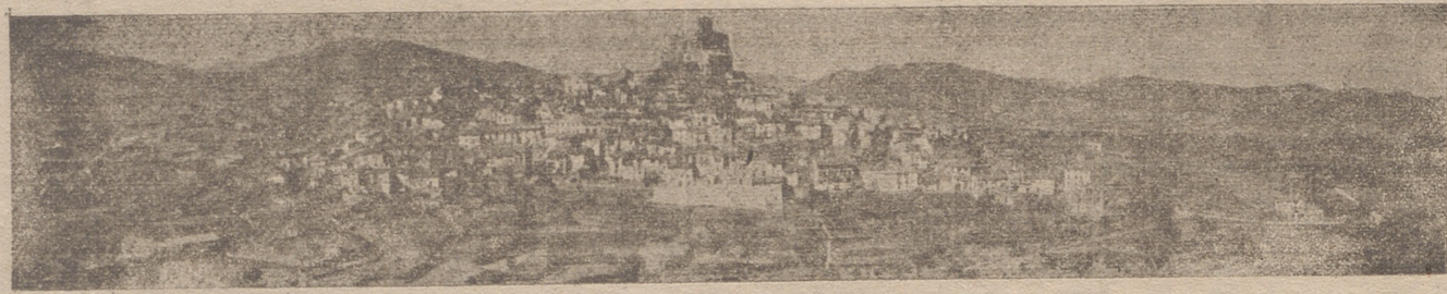
VISTA GENERAL DE CORNAGO