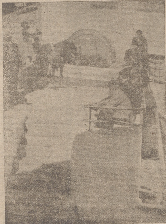
FUENTE PUBLICA EN LA PLAZA DE DON CARLOS PINILLA, CUYAS AGUAS SON TRAJIDAS DESDE 3 KM. DE LA VILLA.

amplia vía que da entrada a la villa y que, después de la gran obra de hormigonado efectuada en la misma, presenta un aspecto verdaderamente magnífico, llevando también el nombre de don Carlos Pi-