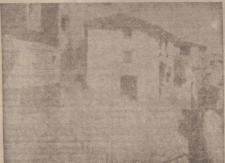
CALLE DE DON ALBERTO MARTIN GAMERO, QUE HA SIDO TOTALMENTE HORMIGONADA Y EMBELLECIDA.

Grandes atracciones, conciertos de música, funciones teatrales y cinematográficas. Bailes públicos y de sociedad, etc.