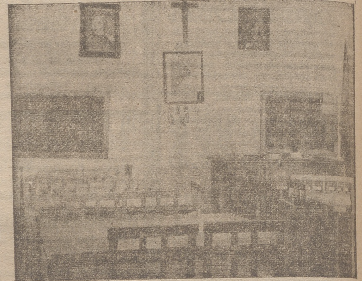
INTERIOR DE UNA ESCUELA DE PARVULOS DE LAS DOS CONSTRUIDAS RECIENTEMENTE.

tudes y de una banda municipal de música. Carretera de circunvalación. Construcción del Centro de Higiene Rural. Arreglo del grupo