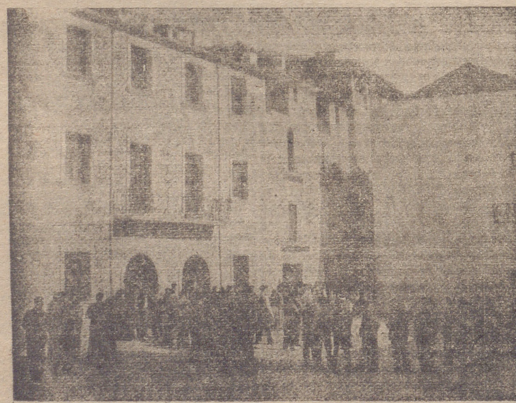
NUOVO AYUNTAMIENTO Y FRONTON EN LA PLAZA DE DON CARLOS PINILLA

contraron pronta y favorable acogida en nuestro gobernador civil, don Alberto Martín Gamero, y en el entonces subsecretario de Trabajo, don Carlos Pinilla Turiso, quienes comprendieron las nobles preocupaciones sociales del alcalde cornagués, y estimando el acierto de sus propósitos, prestaron en todo momento