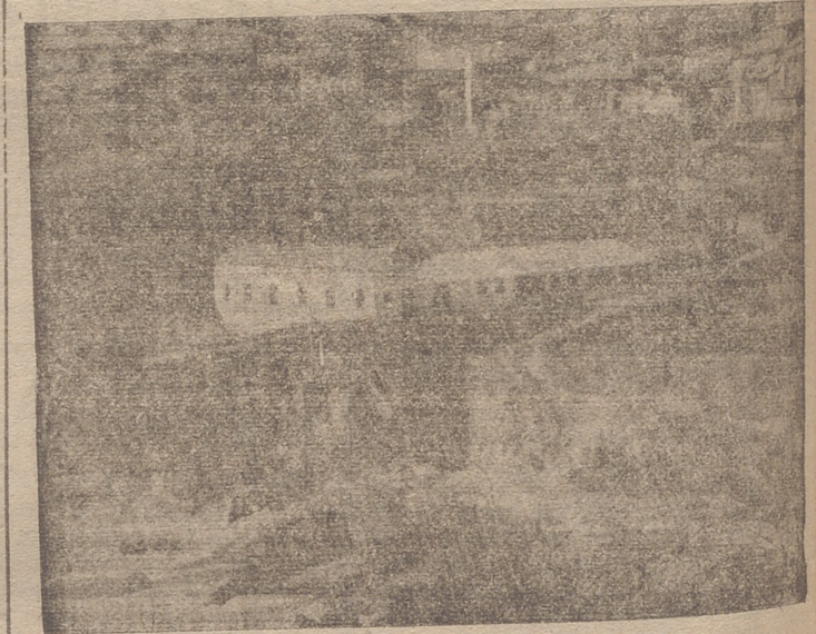
NUOVO MATADERO MUNICIPAL, CON SERVICIO DE AGUAS, LAVADERO Y ABREVADERO.

rige ya a la consecución de más ambiciosas metas. En la Memoria a que nos hemos referido quedaban ya apuntadas como nuevos objetivos para la tarea inteligente e incansable: Construcción de viviendas económicas; pavimentación de más calles; creación de una biblioteca municipal; construcción de evacuatorios públicos; gestiones y ayuda para levantar una presa en el río Linares que permita el mejor aprovechamiento de las aguas