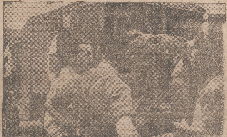
Sajo el tragar de la gran batalla de Normandía, los médicos militares alemanes efectúan operaciones difíciles, salvando la vida a muchos heridos que después son evacuados a los hospitales de la retaguardia.