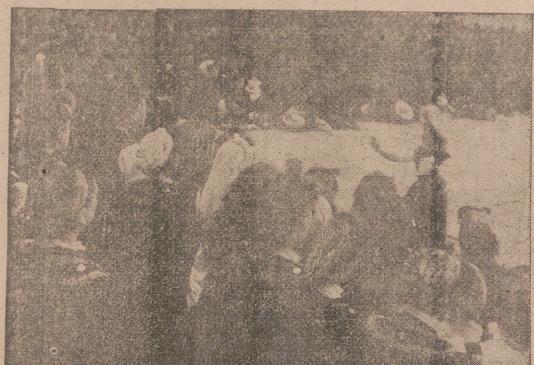
Una de las brillantes actuaciones de los Coros de la Sección Femenina durante la grandiosa II Concentración Nacional celebrada en El Escorial.

Camaradas de la Sección Femenina: Al recibir en este día vuestra dedicada ofrenda de esta espada con el laurel de la victoria y las cinco rosas simbólicas del sacrificio, quiero reiteraros mi fe en vuestra obra que, unida a la de las demás juventudes españolas, renovarán a la Patria sus primaveras de laureles y rosas. Virtud de nuestro Movimiento es levantar y convertir en vivo lo que se encuentra como dormido o muerto. Si pensásemos en hacer un homenaje al más poderoso de nuestros reyes, al fundador del Monasterio escorialense, no creo fuera para él nada más grato que el sentir al abrigo de estos muros seculares el calor de las juventudes españolas entervivizadas en sus sentimientos de servicio y de exaltación hacia la Patria. Canciones de juventud, himnos de fe, ambiciones de gloria y cantos de esperanza, que convierten al antes viejo y triste panteón en templo del Imperio y símbolo del resurgir de España.