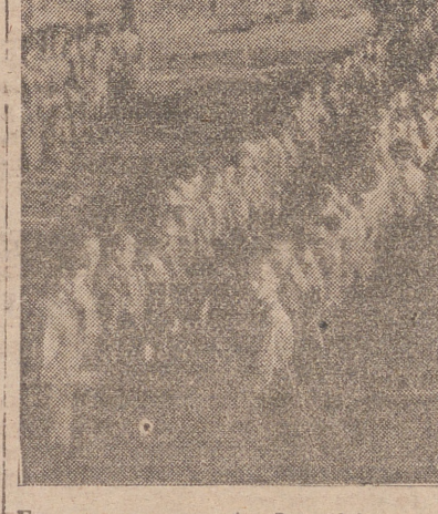
En un campamento de prisioneros se administra a éstos la Comunión.