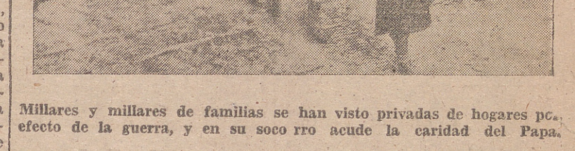
Millares y millares de familias se han visto privadas de hogares por efecto de la guerra, y en su socorro acude la caridad del Papa.