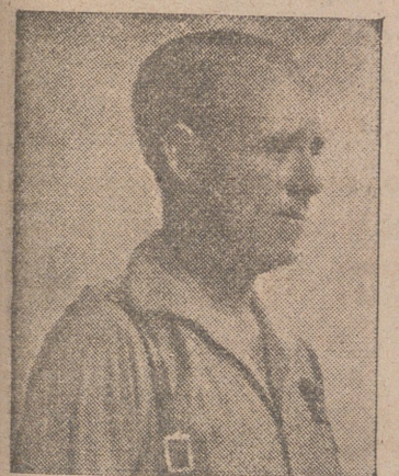
EL MINISTRO DEL EJERCITO GENERAL ASENSIO

También ha recibido otra Medalla de la Asociación de Santa Eulalia