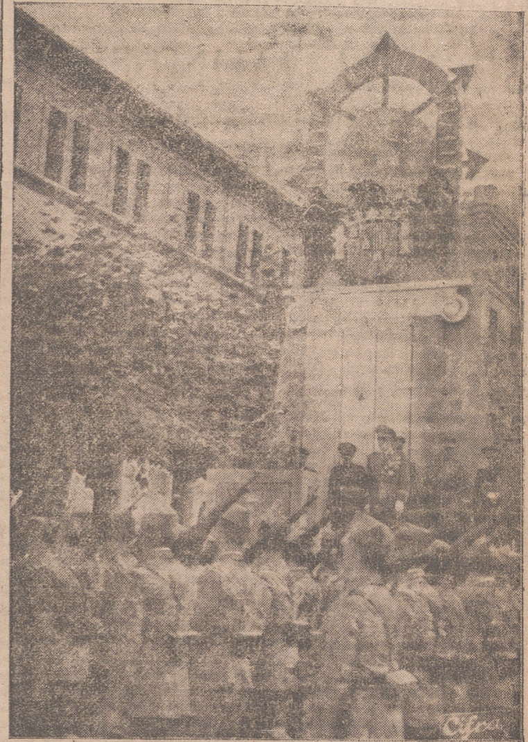
SAN SEBASTIAN.—Durante su visita a los cuarteles de Loyola, el Caudillo preside el desfile de las fuerzas que se alojan en ella.

El Caudillo, en los cuarteles de San Sebastián