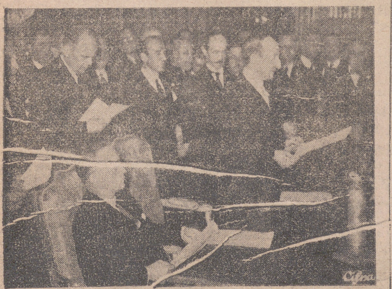
Esta fotografía recoge una de las últimas ocasiones en que han de verse juntos los ministros de Asuntos Exteriores de Francia y Alemania, Sres. Bonnet y Ribbentrop.

Hace falta ya ser ingenuamente optimista para pensar que la guerra puede evitarse. Y, no obstante,