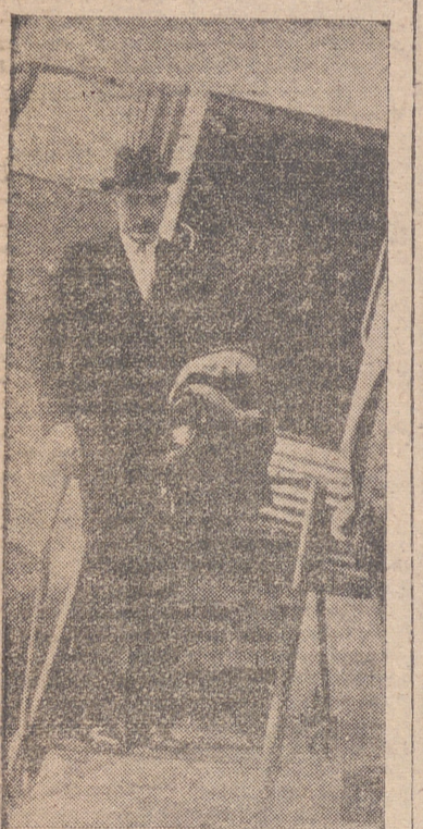
Hter. Henderson, a su regreso de Londres, portador de la respuesta de Inglaterra al Canciller Hitler.

Los más grandes conflictos políticos que amenazaban la paz mundial, iban resolviéndose sin que entrasen en juego las armas.