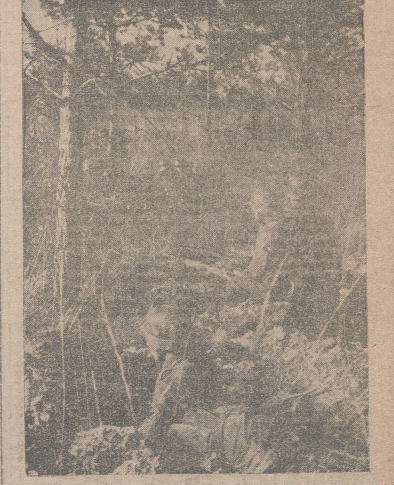
El piloto de un avión enemigo derribado sobre las líneas alemanas en el frente del Este, el cual pudo salvarse mediante su paracaídas, durante un interrogatorio a que es sometido por este intérprete de una división alemana.