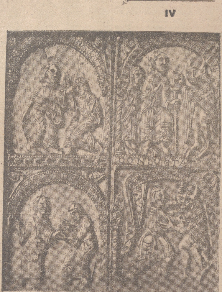
MARFILES DE SAN MILLAN. UNA DE LAS PLACAS