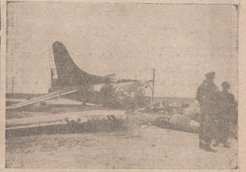
Avión americano de bombardeo derribado por los cazas alemanes en la zona de combate de Túnez.