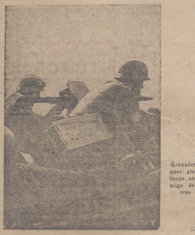
Granaderos de tanques alemanes hacen fuego contra el enemigo desde sus carros blindados