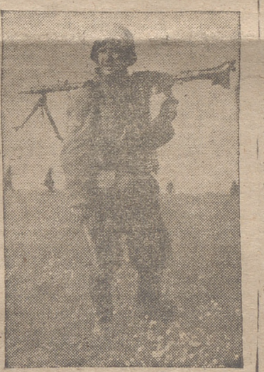
He aquí un soldado alemán después de un contraataque realizado con éxito

Por su parte, la décima división blindada italiana, estacionada hacia el interior sobre la carretera entre Bengasi y Ags