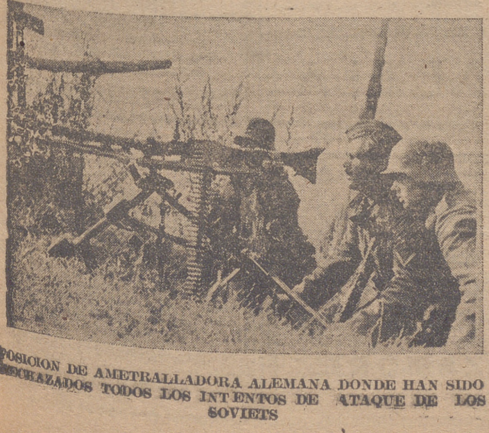
POSICION DE AMETRALADORA ALEMANA DONDE HAN SIDO RECHAZADOS TODOS LOS INTENTOS DE ATAQUE DE LOS SOVIETS