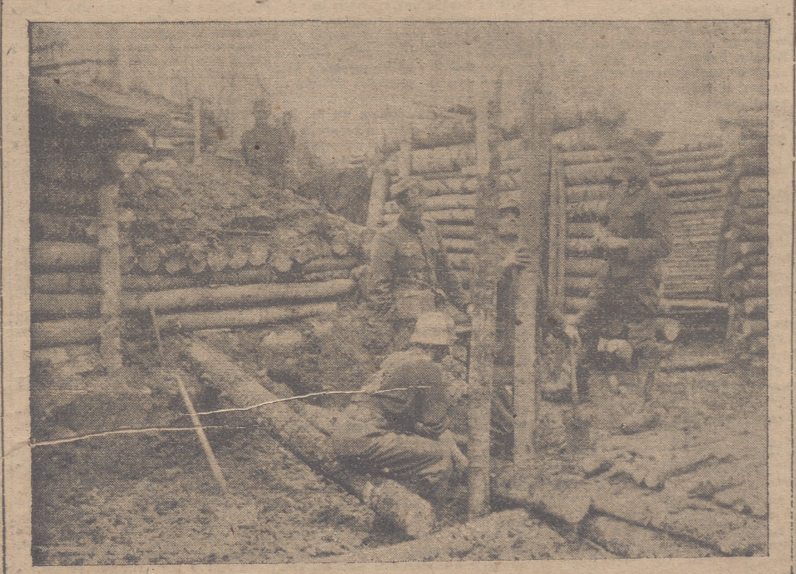
PUERTO DE MANDO DE UN BAT ALLON ALEMAN ESTABLECIDO EN EL AGUJERO FORMADO POR LA BOMBA DE UN AVION