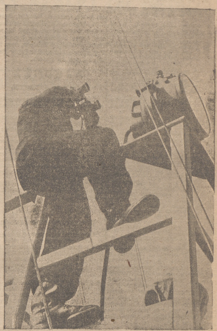
El vigía en una linterna rápida alemana, en servicio de vigilancia. El reflector le sirve para comunicar las señas a otras unidades durante la noche.

dos unos 20 carros. Los aviones bombardearon con gran eficacia, las concentraciones, convoyes y líneas de operaciones del enemigo.—(Efe.) BERLIN.—Cuatrocientos noventa carros blindados, bolcheviques han sido totalmente destruidos o puestos fuera de combate, en el curso de las operaciones registradas durante los últimos seis días, en el frente oriental. WASHINGTON.—Si la resistencia británica en Egipto se derrumba, los aliados verán totalmente modificada su situación militar, y la guerra puede prolongarse durante una decena de años, opinan algunos técnicos norteamericanos. Estos técnicos dicen ser muy significativos el hecho de que la reunión del Consejo de guerra del Pacífico, celebrada en la Casa Blanca, haya sido totalmente consagrada al estudio de los acontecimientos de Egipto. La situación en este teatro de la guerra sigue considerándose aquí como muy crítica; y tanto el público como las personalidades dirigentes, creen necesario reforzar, urgentemente, las posiciones británicas del Oriente medio. Ha desaparecido el pesimismo que se dejaba notar hace algunos días; pero, sin embargo, existe honda preocupación por lo que pueda suceder.—Efe.