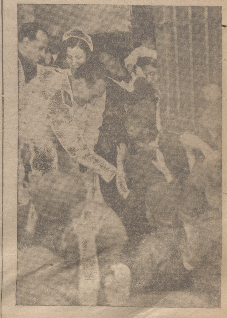
ALMERIA. El Ministro Secretario del Partido, camarada Arrese, inaugurando en Berja el Hogar José Antonio, de Auxilio Social.

«Durante la noche última, una poderosa formación de nuestros bombarderos efectuó una incursión sobre el Noroeste de Alemania.