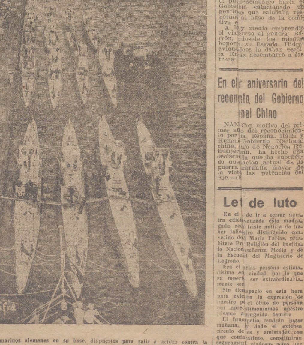
Submarinos alemanes en su base, dispuestos para salir a actuar contra la marina enemiga.