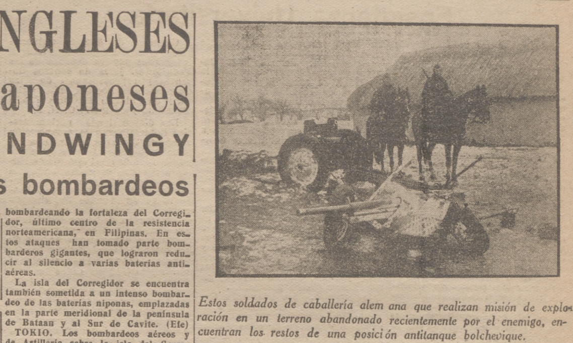
Estos soldados de caballería alemana que realizan misión de exploración en un terreno abandonado recientemente por el enemigo, encuentran los restos de una posición antitanque bolchevique.