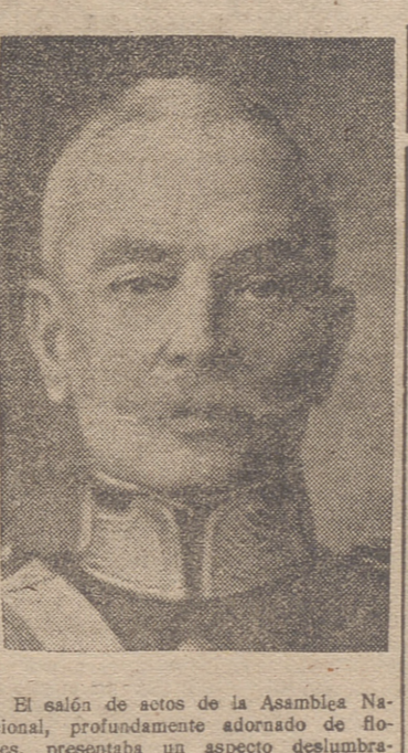
El salón de actos de la Asamblea Nacional, profundamente adornado de flores, presentaba un aspecto deslumbrante. Todas las tribunas se hallaban atestadas de público. En el Cuerpo diplomático se encontraban el Nuncio de Su Santidad, los embajadores, entre ellos el de España, y ministros acreditados cerca del Gobierno portugués. En la tribuna próxima a la anterior se hallaban S. E. el Cardenal Patriarca y la familia del jefe del Estado. Todas las jerarquías civiles y militares y dignidades eclesásticas se encontraban presentes. El Gobierno, en pleno, ocupaba un lugar preferente.

Portugal celebró ayer la toma de posesión de la Jefatura del Estado por el General Carmona con júbilo desbordante, nacido de ver mantenida así la firme garantía de su ruta de paz, honor y prosperidad que hace ochocientos años inició venturosamente al asumir aquél por primera vez la más alta magistratura de la Nación. El solemne acto ha dado ocasión para que el pueblo portugués reafirmara su fe, expresada fervorosamente, en las virtudes y en la inteligente política del jefe de la Nación, que noblemente consagró su vida al servicio de los destinos patrios y que enérgica y sabiamente dirige la nave del Estado, salvando los graves obstáculos que se alzan en la agitada situación internacional presente.