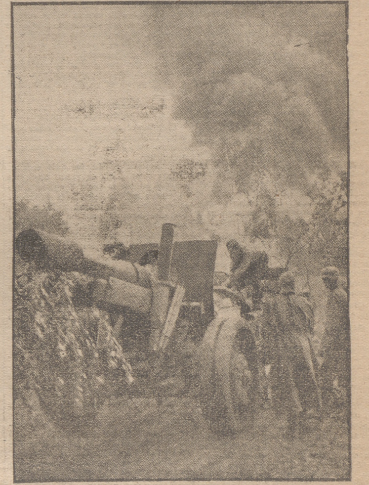
Pieza de artillería de largo alcance, soviética, capturada.—El tractor fue incendiado por las tropas alemanas. Hasta el 1 de octubre las tropas alemanas han capturado o destruido 22.000 cañones rusos.

SOFIA. El Presidente del Consejo, Filoff, ha presentado hoy al rey la dimisión del Gabinete. El soberano la ha aceptado y ha encargado a Filoff de la formación de nuevo Gobierno. (Efe.)