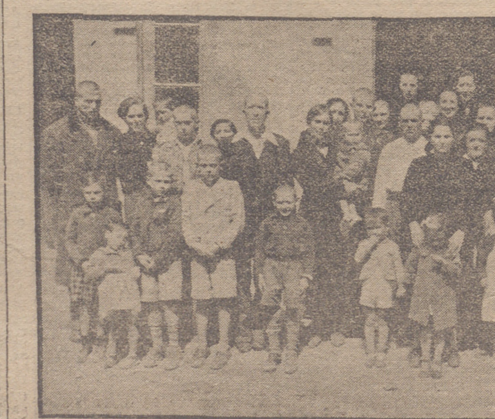
LAS FAMILIAS BENEFICIARIAS

EL SEGUNDO GRUPO DE VIVIENDAS Terminado el acto de inauguración, se trasladaron las autoridades al segundo grupo de viviendas, actualmente en construcción, examinando el estado de las obras, que se llevan con el ritmo im-