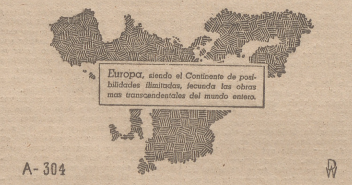
Europa, siendo el Continente de posibilidades ilimitadas, fecunda las obras más trascendentales del mundo entero.

Hace 75 años, el 17 de Enero de 1867, el ingeniero alemán Werner Siemens presentó a la Academia de Ciencias de Berlín su célebre informe sobre su primer dinamo inventada ya por él en 1866. Con su descubrimiento del principio dinamoeléctrico, Siemens proporcionaba al mundo el medio para encargar corrientes eléctricas de la intensidad que se deseara. De la realización de esta idea se beneficia hoy el mundo entero con la aplicación de la electricidad en todas las actividades humanas.