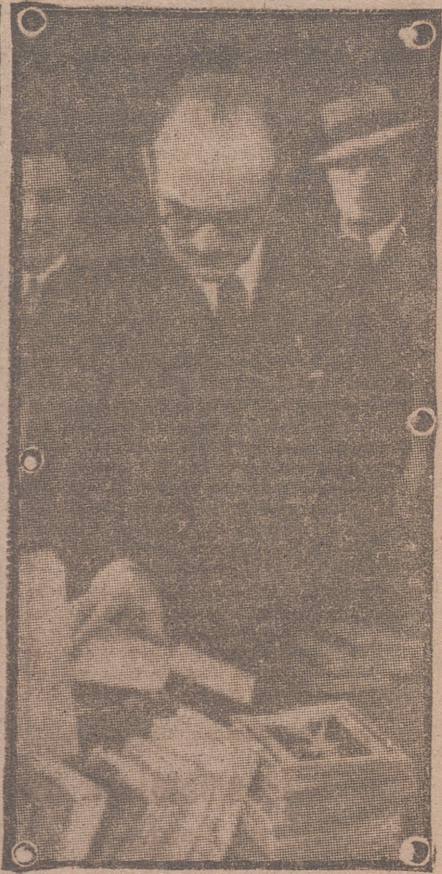
El Ministro de Educación Nacional, señor Ibáñez Martín, examinando uno de los puestos instalados en Madrid con motivo de la Semana del Libro.

MADRID.—Para el cumplimiento de la misión que la ley de 1 de marzo último, para la represión de la masonería y el comunismo, asigna al Consejo Superior del Ejército, se publicará mañana en el «Diario Oficial del Ministerio del Ejército», una orden en la cual, y en cumplimiento del artículo 11 de dicha ley, y a los fines de aprobación de las actuaciones de tribunales de honor, constitución del tribunal mixto y revisión de los fallos de dichos tribunales, se dispone que el Consejo Superior del Ejército funcione ampliado con un representante del Ministerio de la Marina y otro del del Aire