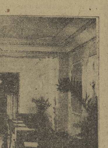
He aquí un aspecto parcial del "Rhin", después de la reforma. La silueta gráfica revela el gusto y la elegancia del montaje.