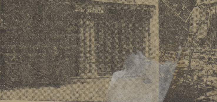
Fachada del Bar Rhin, antes y después de las obras realizadas. A través de esta comparación se advierte mejor el volumen de la reforma, con lo que el aspecto exterior ha ganado presencia y atractivo.

Últimos nuestra felicitación a lo de todos los que ayer la expresaron a la empresa, que ha montado un Rhin renovado, que atrae y retiene, y esto ya es el máximo de lo que puede conseguirse.