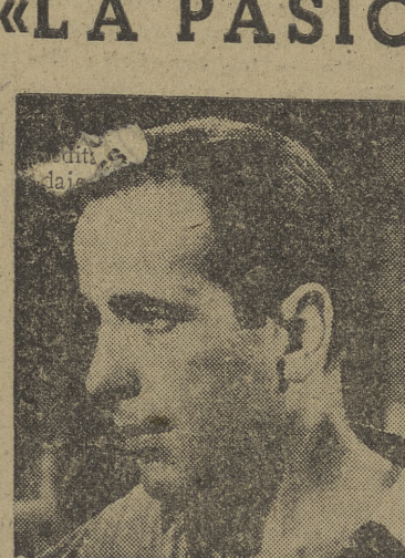
Es el título de la película estrenada ayer con gran éxito de público y crítica en el cine Cordon, y en la que son intérpretes magníficos George Raft, Ann Sheridan, Ida Lupino y Humphrey Bogart. He aquí una escena de "La pasión ciega".