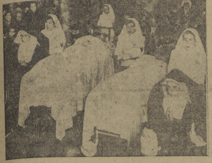
Enfermos y niñas de la Cruz Roja y monjas de la Caridad, durante la misa celebrada ayer en la parroquia de Sta. Lorenzo, como final de la visita a la ciudad de Santa María la Mayor. (Información en segunda página de nuestra edición de Burgos.)