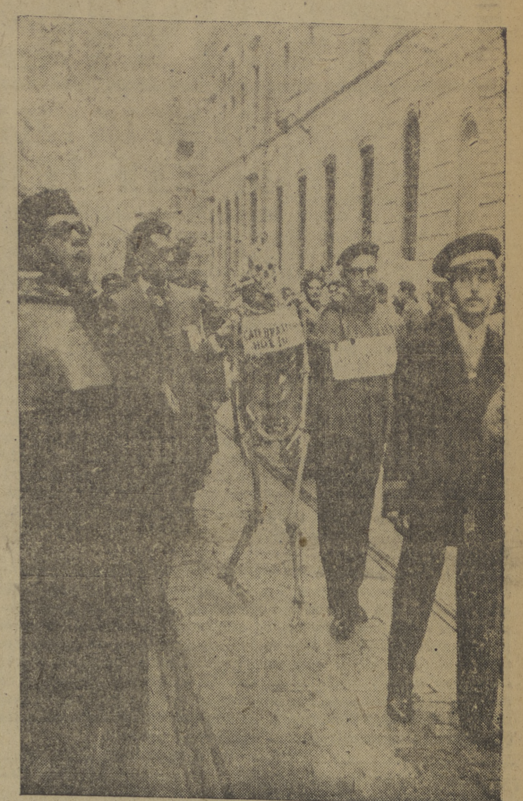
Como ya es tradición, se ha celebrado en la Facultad de Derecho de la Universidad Central "La fiesta del Rollo", que organizan los estudiantes que han terminado la carrera de Derecho. Consiste en una cabalgata plana de buen humor, en la que los estudiantes marchan ataviados con trajes aegóricos a las distintas disciplinas y personaljes de la Universidad. El esquete representa al catedrático "hueso".