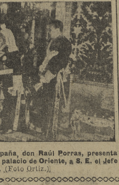
El embajador del Perú en España, don Raúl Porras...