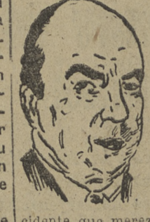
El presidente Gallegos...