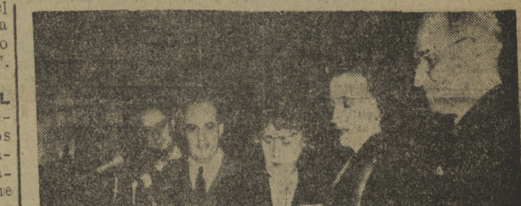
El presidente Truman, acompañado de su mujer y de su hijo, que por primera vez participaba en una campaña de esta clase, deposita su voto, que, naturalmente, también ha contribuido a su propio triunfo.

WASHINGTON, 6. — Los últimos resultados, todavía incompletos, de la elección presidencial estadounidense son: Truman: 28.079.060. Dewey: 21.094.756. Wallace: 1.094.877. Thurmond: 925.226. (Efe.)