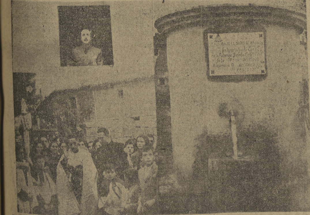
Reportaje gráfico de los actos de ayer en Castriello Matajudios. - A la derecha, la fuente construida por la Junta Técnica. - Arriba, el señor Rodríguez de Valcárcel se dirige al vecindario y un momento de la bendición por el cura párroco del pueblo

El excelentísimo señor Rodríguez de Valcárcel recibió la adhesión y gratitud del vecindario CASTROJERIZ. — (De nuestra correspondencia) Ha sido hoy nuestra comarca la que ha llegado la mano y el corazón bienhechor de nuestro excelentísimo gobernador civil y provincial del Movimiento, don