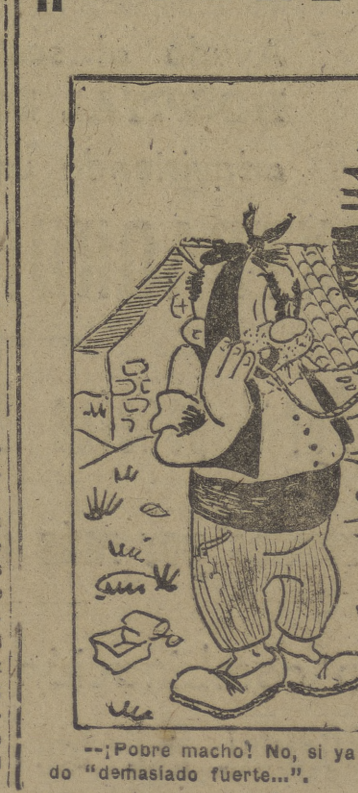
— "¡Pobre macho! No, si ya me parecía a mí que lo había estado demasiado fuerte..."