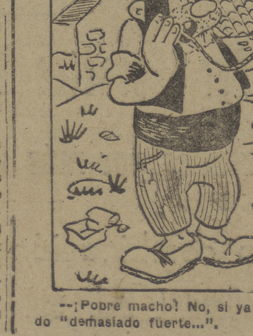
— "¡Pobre macho! No, si ya me parecía a mí que lo había estado demasiado fuerte..."