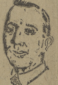
John Foster Dulles