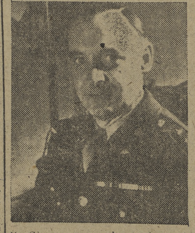
D. Clay como gobernador militar norteamericano. (Efe.)

na ha batido todos los "récorcs" de exportación de la posguerra, en el pasado mes de septiembre, con una cantidad de productos valorados en sesenta y un millones de dólares, según ha anunciado la agencia de importación y exportación. El "récor" previo fue establecido en agosto, con productos por valor de cincuenta y ocho millones de dólares. (Efe.) TERMINAN EL NUEVO AERODROMO BERLIN, 5. — Un avión norteamericano del tipo "Skymaster", realizó el primer aterrizaje de prueba en el nuevo aeropuerto de Tegel, destinado al aterrizaje de los aparatos que operan en el programa de ayuda a Berlín.