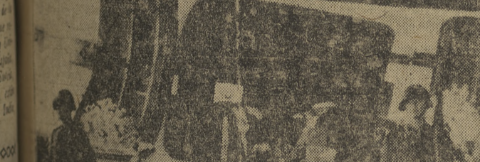
Mortales del conde Bernadotte pasan por Suiza, en la entrada de Ginebra, soldados del Ejército suizo hacen guardia en el conde Bernadotte del conde de la O. N. U. en Palastina y del coronel Serot entre coronas.