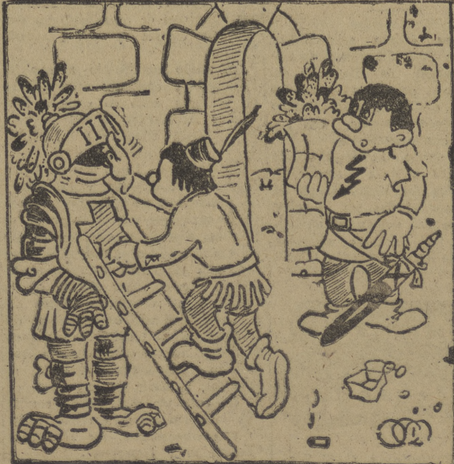
--El capitán Clodolfo? --No sé... ¡Voy a ver si está!