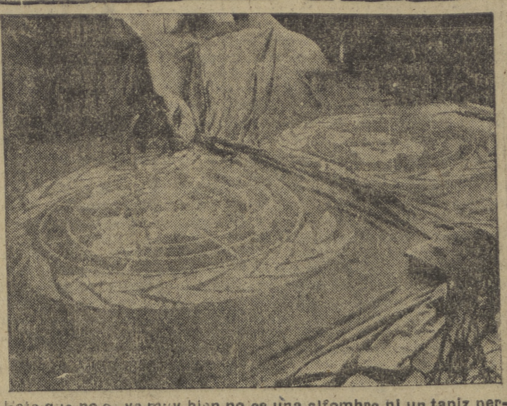
Esto que no se ve muy bien no es una alfombra ni un tapiz persa, es nada menos que la bandera de las Naciones Unidas, confeccionada a unas medidas gigantescas. Bajo sus enormes pliegues se reunirá la Asamblea General en París y a su sombra es posible —casi seguro— que se vuelva a hablar de la paz y de la necesidad de cooperar activamente a la solución de los cuatro o cinco conflictos graves que la Organización va tratando desde su fundación, sin haber conseguido otra cosa que aumentar los libros de actas con declaraciones solemnes, vetos, obstrucciones y todo eso que es frecuente en las reuniones internacionales. La muchacha que trabaja en los últimos toques a la bandera es sin duda lo más interesante que hay en esta fotografía.

PARÍS, 6. — Bernadotte ha enviado un cablegrama al Consejo de Seguridad diciendo que la violación realizada el 12 de Agosto del conducto de agua de Jerusalén que abastecía la parte oriental de la ciudad, constituyó un "acto deliberado" de los árabes y, por tanto, una violación de la tregua. Agregó que Bernadotte que se realizan esfuerzos para reparar dicho conducto. (Efe.)