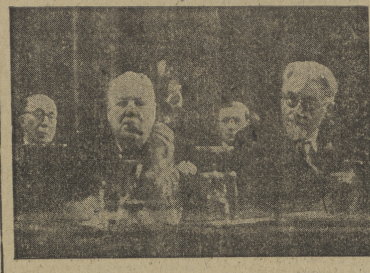
bierno de régimen socialista, sino experimento, experiencia. El socialismo es por definición internacionalista, pero ante las realidades de momento deriva a un nacionalismo digno de cualquier «tory», aunque éstos no lo creen así.

cha y el Gobierno, o la experiencia, como preferían, da sensación de dirigido por los acontecimientos y no de dirigente de ellos. Y esta, quizás, sea la razón