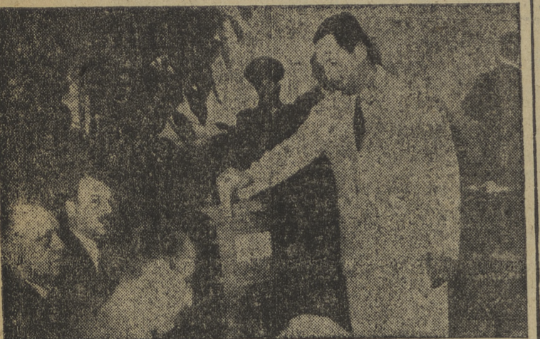
El presidente Perón deposita su voto en las elecciones que lo dieron el poder.