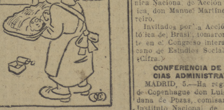
Enfermera: — ¡Mire, tres gemelos ha tenido! Padre: — ¡¡Mios?! ¡Le advierto a usted que ese señor está aquí antes que yo... ¿eh?!