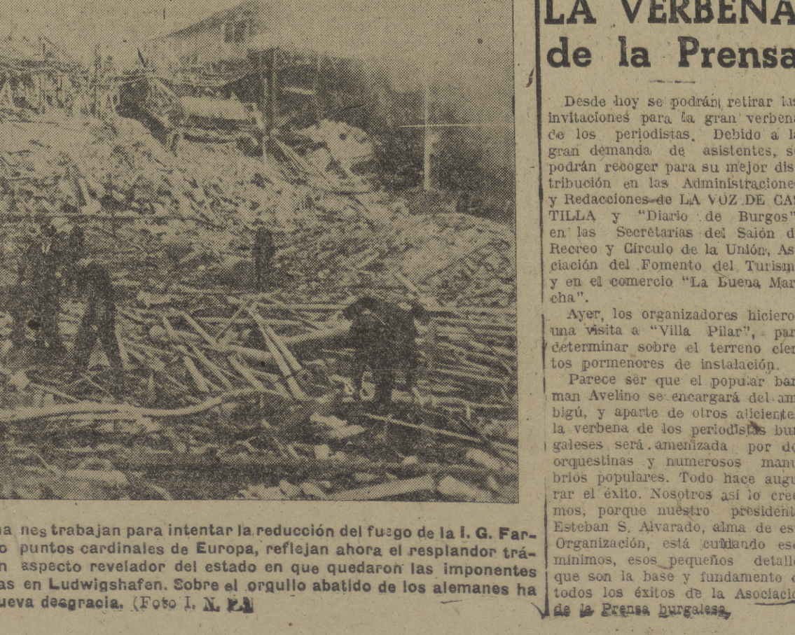
La primera "foto", soldados americanos y voluntarios alemanes trabajan para intentar la reducción del fuego de la I. G. Farben. Los cascos militares que recibieron el sol de los cuatro puntos cardinales de Europa, reflejan ahora el resplandor trágico de una catástrofe inmensa. — En la otra se recoge un aspecto revelador del estado en que quedaron las imponentes instalaciones industriales que la I. G. Farben tenía montadas en Ludwigshafen. Sobre el orquillo abatido de los alemanes ha posado sus alas una nueva desgracia.