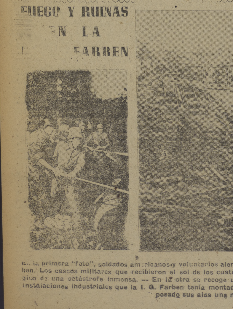
La primera "foto", soldados americanos y voluntarios alemanes trabajan para intentar la reducción del fuego de la I. G. Farben. Los cascos militares que recibieron el sol de los cuatro puntos cardinales de Europa, reflejan ahora el resplandor trágico de una catástrofe inmensa. — En la otra se recoge un aspecto revelador del estado en que quedaron las imponentes instalaciones industriales que la I. G. Farben tenía montadas en Ludwigshafen. Sobre el orquillo abatido de los alemanes ha posado sus alas una nueva desgracia.

ro. Entonces yo, ciertamente, me senti obligado, por primera vez, a no aceptar aquel donativo demasiado bruscamente, sino por sucesivas etapas. "Oh, tío, muchas gracias". "Bien, como tu quieras", me dijo. Y ya nunca tuve ni el duro ni los dos reales. Pero siempre, en la puerta de su despacho, noté el resusquillo emocionante de su posibilidad, la pura emoción de pisar aquel santuario. Como tres sobrinos tímidos —a por el duro y los dos reales— los representantes de esa entelequia política que se atribuye a sí misma todas las virtudes del Occidente, han aguardado a la puerta del despacho del tío Pepe. Al cabo de dos horas han salido de buen humor, hablando por los codos, pero sin decir nada, por supuesto. Exactamente, nadie sabe cuáles son las razones que impulsan al Occidente a mendigar sus dos reales de compromiso, o su ducado de paz, del bolsillo del chaleco del tío Pepe. Pero el tío Stalin sabe manejar su crédito, su panza, su renta o su despacho. Mucho hablaban las relaciones, hasta que el azar nos hacía tropezar o la necesidad me obligaba a buscarle desesperadamente. Recordar —con dolor— que ciento diez años, con el crecimiento vinieron los pantalones de golf; el tío me miró y reí. Eché mano de sus dos reales, vació un momento y se decidió a sacar un du-