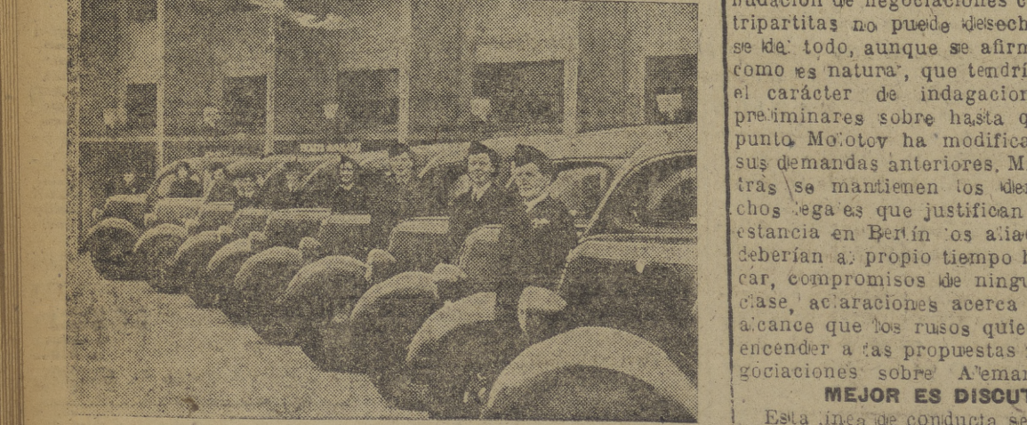
Esto es alineación y uniformidad. No se trata como podría suceder de un grupo de automovilistas de los Servicios Auxiliares femeninos del Ejército que se preparan a embarcar para cualquiera de los lugares donde las gentes andan a tiros. No. Es, sencillamente, una sección de conductores ingleses, a cuyo cargo estará el traslado de los atletas olímpicos, durante la celebración de las diversas pruebas deportivas de Wembley.

Se ignora todavía si la constatación soviética será objeto de debate en el Parlamento, aunque se afirma en los círculos parlamentarios que el