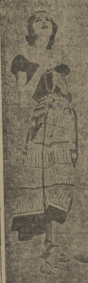
Sin ánimo de entrar en discusiones, a nosotros este conjunto nos parece precioso. Ahora, que si a nuestros colegas no les gusta preferimos confesar que entendemos poco. Según las referencias que poseemos — dignas de crédito — la falda es de piqué estampado, y la blusa, negra, de algodón. Nos aseguramos que este conjunto es ideal y de aplicación doble: sirve para playa y para pista de baile.

Los occidentales temen que los rusos repitan la maniobra WASHINGTON, 16. — Se veía que las potencias occidentales estudian la posibilidad de que Rusia pueda en breve imponer restricciones en el transporte de Viena, análogas a las de Berlín. Gran Bretaña y Francia no se sorprendían si los soviéticos impusieran repentinamente tales restricciones en Viena, cuya capital se encuentra profundamente situada en la zona de ocupación soviética de Austria y se halla bajo el control de las cuatro potencias. (Efe).