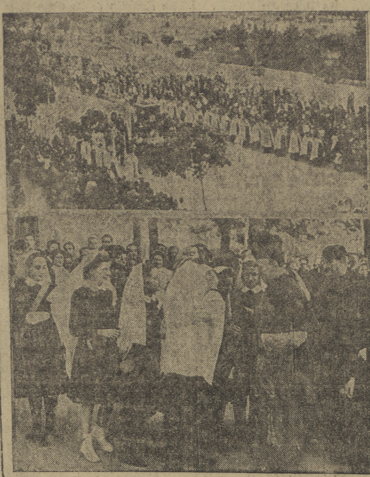
Nuestro fotógrafo Villafraña ha captado dos momentos de la fervorosa y emocionante jornada carmelitana vivida ayer por nuestra ciudad. El pueblo en masa presenció el desfile triunfal de la venerada imagen de la Virgen del Carmen en la procesión presidida por las autoridades y en la que participaron ininidad de fieles. Nuestro amadísimo prelado acogió paternalmente a un grupo de niños que acudieron a besar su anillo pastoral.