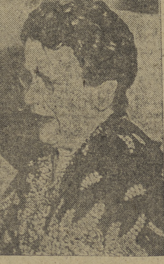
Misterio en el suicidio de la artista cinematográfica Carole Landis. Andan en juego unas notas que, al parecer, encerraban la clave de la terrible decisión, pero han desaparecido. El dolor abruma a los padres de Carole en los momentos en que recibieron la infeliz noticia.

RIO DE JANEIRO, 16. — El Gobierno brasileño envió un buque de guerra a España para que represente a la Armada del Brasil en los actos conmemorativos del VII centenario de la creación de la Marina española. (Efe). Ciudad de Trujillo, 16. — Un destructor de la flota dominicana asistirá a los actos que han de celebrarse en el puerto de Sevilla para conmemorar la fundación de la Marina española. (Efe).