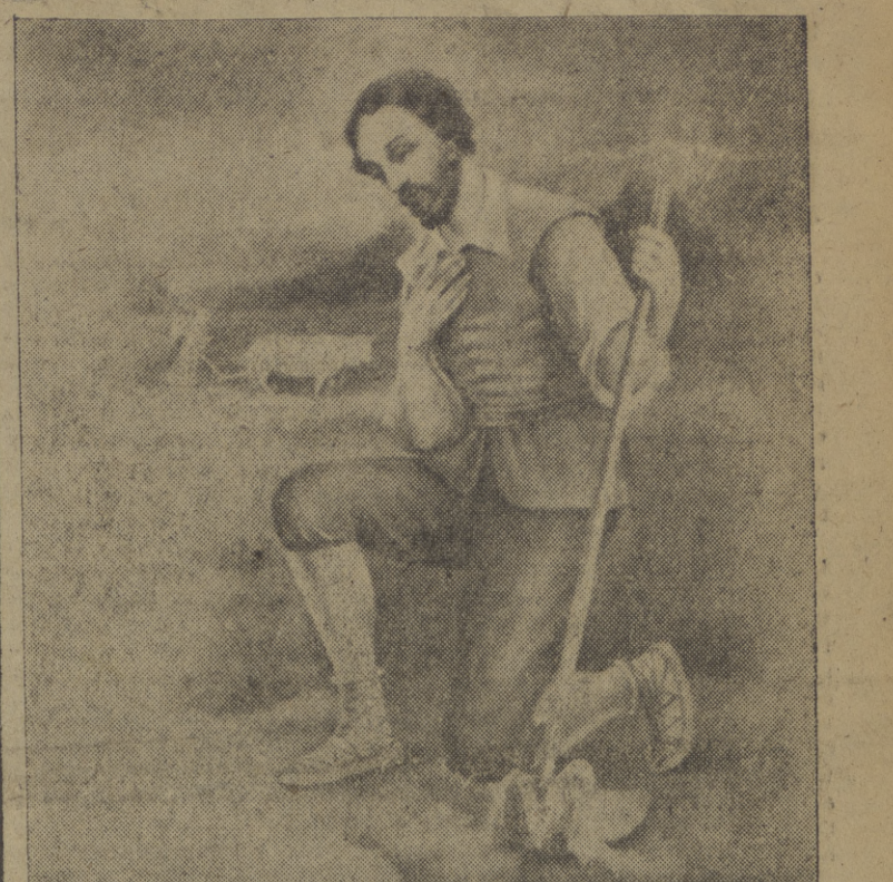
El Señor lo eligió como ejemplo de hombres sencillos y humildes. Repartía las horas del día entre la oración y el trabajo y el pan que ganaba también lo distribuía con los pobres y las ave-cillas. Poco a poco, humildemente, San Isidro mereció dimensiones de Santidad y la tierra se santificó con él y fué elegido ejemplo y patrono de todos los campesinos de España