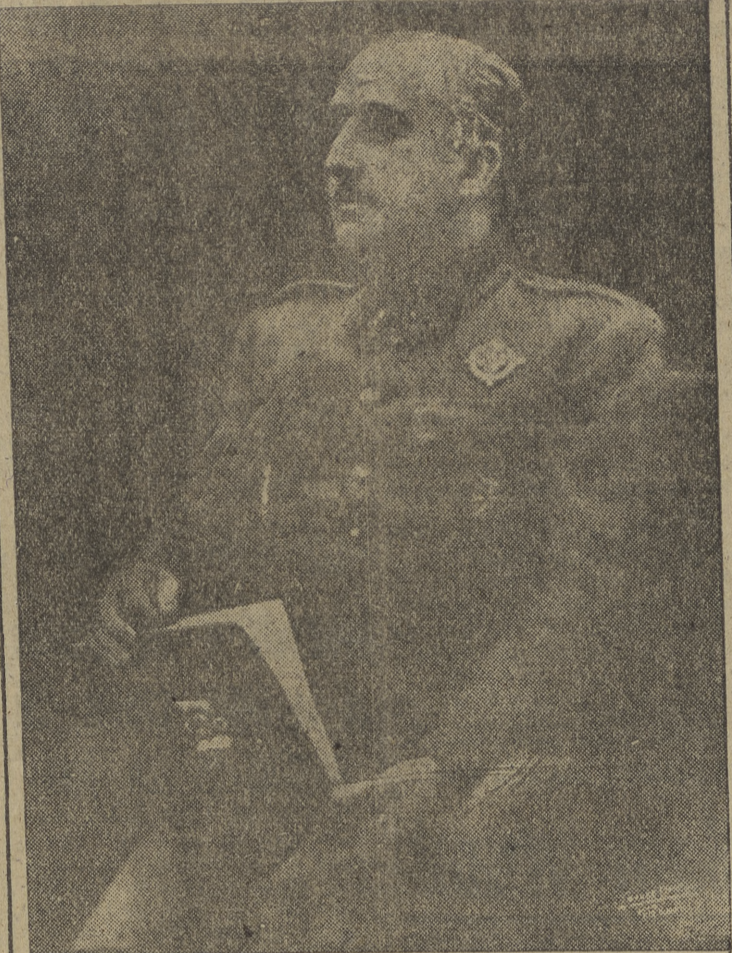
El Caudillo en un momento de su discurso