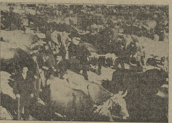
Con gran afluencia de ganado, ha empezado ayer la tradicional "Feria de San José", este año aplaza hasta la anterior Jornada, a causa de coincidir en sus días tradicionales con la Semana Santa. He aquí un aspecto del ferial en su primer día.