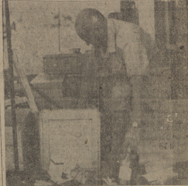
El comandante norteamericano Attilio Gatti, jefe de la expedición que va a investigar las montañas de la Luna, en África, en el momento de comprobar que en su equipo personal no falta nada, a su llegada al puerto de Mombasa, el más importante de la colonia inglesa de Kenya.