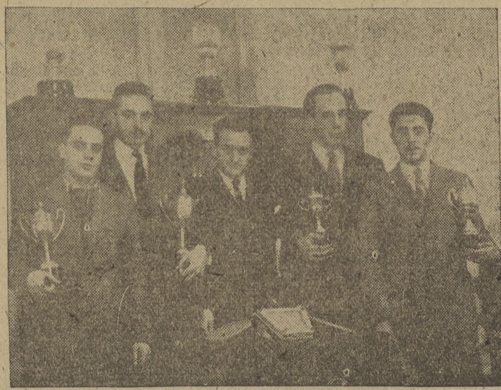
El secretario de Educación y Descanso hace entrega de los trofeos a los vencedores del campeonato de pin-pon local.