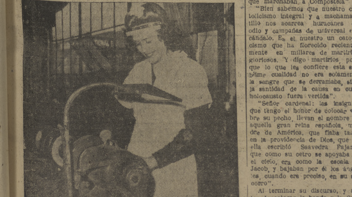
Las empresas hay afiliadas al Consejo Nacional de Seguridad, que utilizan los servicios de este organismo para evitar los accidentes de trabajo; la obra de la "foto" protege sus ojos con un escudo facial transparente.

El martes próximo se inaugura en Burgos e anunciado cursilo de Misionología. De este importante acontecimiento nos ocuparemos ampliamente en nuestro próximo número