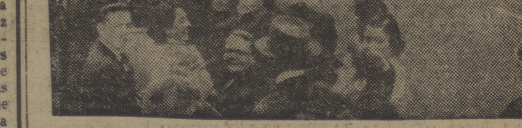
En Londres, por estos días, el calor es sofocante y los habitantes de la metrópoli británica hacen largas colas para darse a las playas del Sur