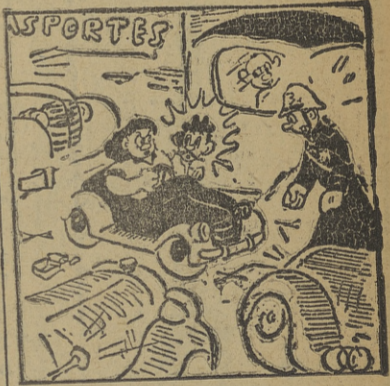
Haz el favor de no decirme nada, Fernando! Yo sabré lo que hay que hacer.