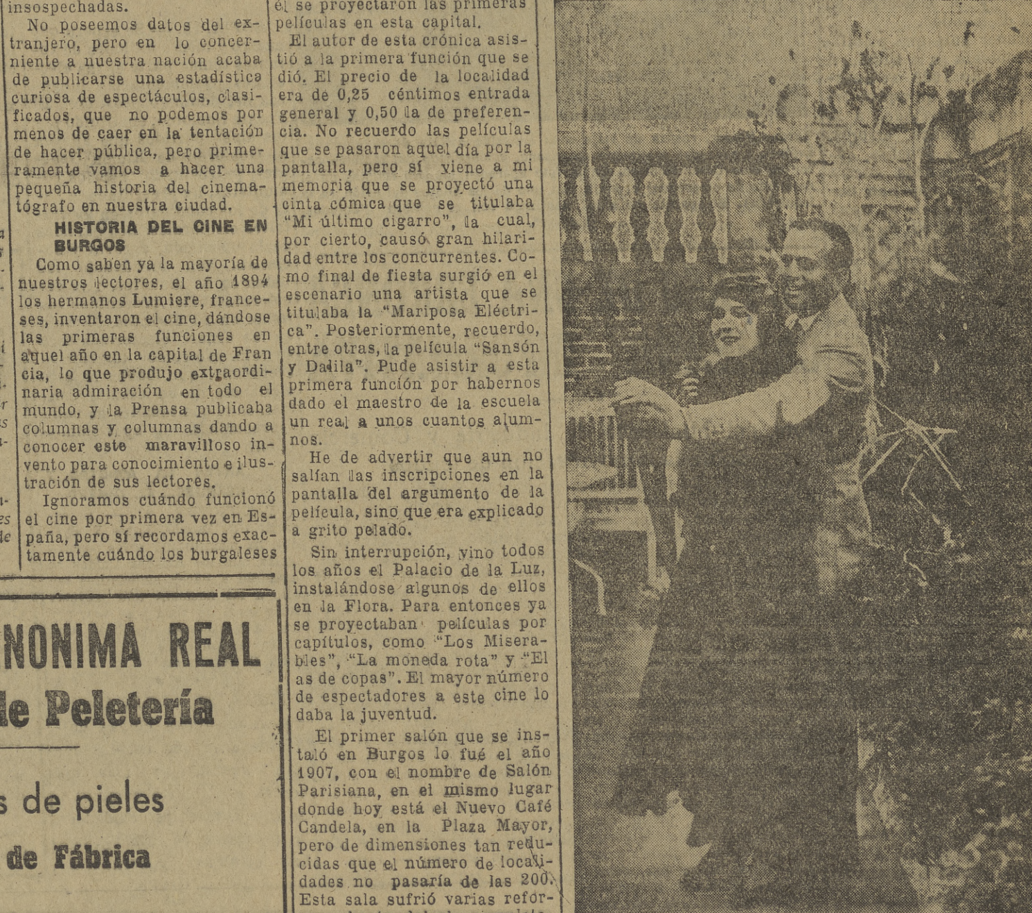
Una vieja estampa del viejo cine. Dauglas Fairbanks (padre) y Mary Pickford ensayan una escena que quizá causó sensación en los buenos tiempos de aquel buen cine sin palabras.

doctores con actividades dentro del espectáculo, es, aproximadamente, el siguiente: Cines, 34.000; Teatros, 16.000; Circo y variedades, 9.000; Toros, 104. Canarias, 66. Castilla la