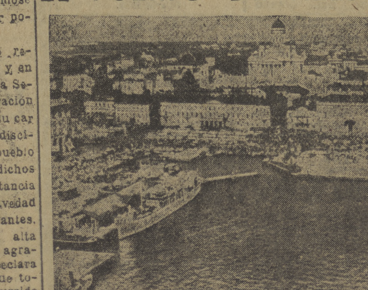
Un bello aspecto de la ciudad de Helsinki, sobre la que gravita ahora el peso de las enormes ambiciones y peticiones rusas