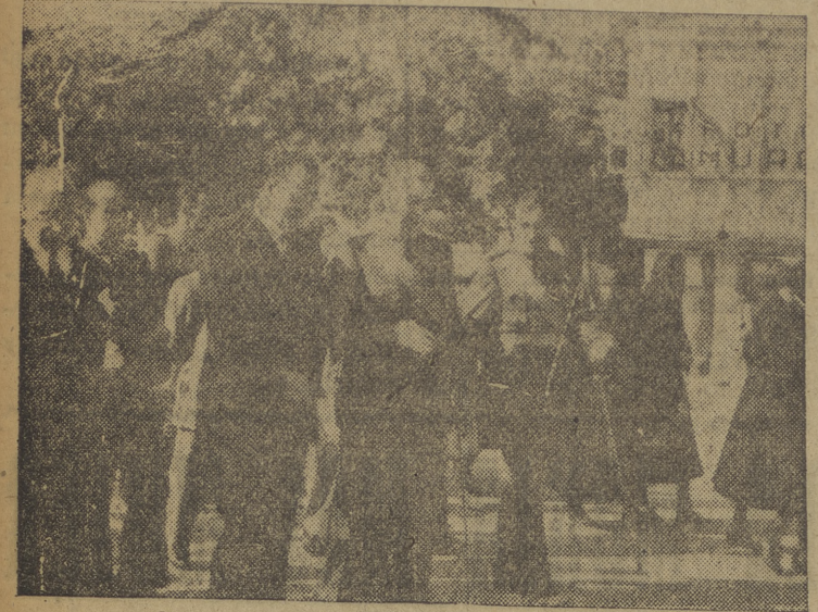
Las autoridades civiles y militares de Miranda de Ebro presidiendo la procesión que con motivo de la festividad de la Fiesta de la Raza se celebró en nuestra ciudad

empate, con el que no podemos estar conformes, toda vez que tal y como se desarrolló el partido, mereció el triunfo de una manera rotunda.