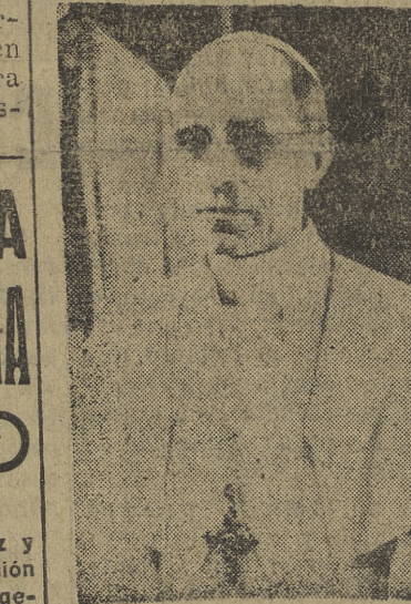
S. S. el Papa

po de Zagreb y primado de Croacia. La declaración de excomunicación hecha por la Sa-