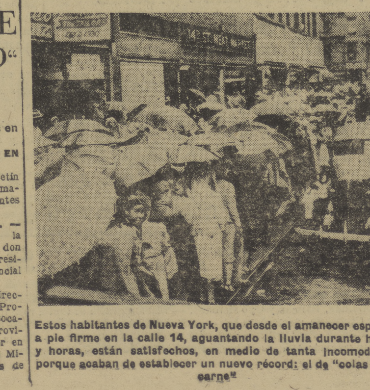
Estos habitantes de Nueva York, que desde el amanecer esperan a pie firme en la calle 14, aguantando la lluvia durante horas y horas, están satisfechos, en medio de tanta incomodidad, porque acaban de establecer un nuevo récord: el de "colas para carne".

Ahora se ha dirigido a los intelectuales argentinos BUENOS AIRES, 9. — El periódico "La Tribuna" ha publicado un editorial en el que comenta un llamamiento que José Giral ha dirigido a los intelectuales argentinos para que realicen propaganda "en favor de la república española". Dice el artículo que Giral y su gabinete tan pronto han recurrido a una astuciosa súplica que delata el vacío que va agrandándose a su alrededor, y añade: "Ha de señalarse igualmente la impavidez, el stremimiento y el cinismo con que Giral sugiere a los intelectuales argentinos que hagan propaganda y conspiren contra un país con el cual sostiene la Argentina excelentes relaciones". — Efe.